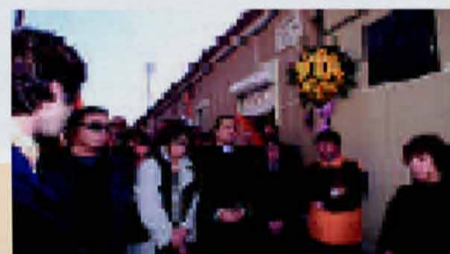
Flores em Camarate