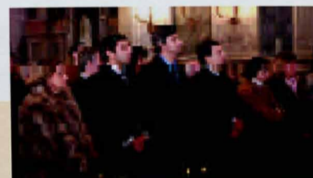
Missa na Basilica da Estrela