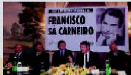
"Francisco Sá Carneiro - 20 Anos Depois"