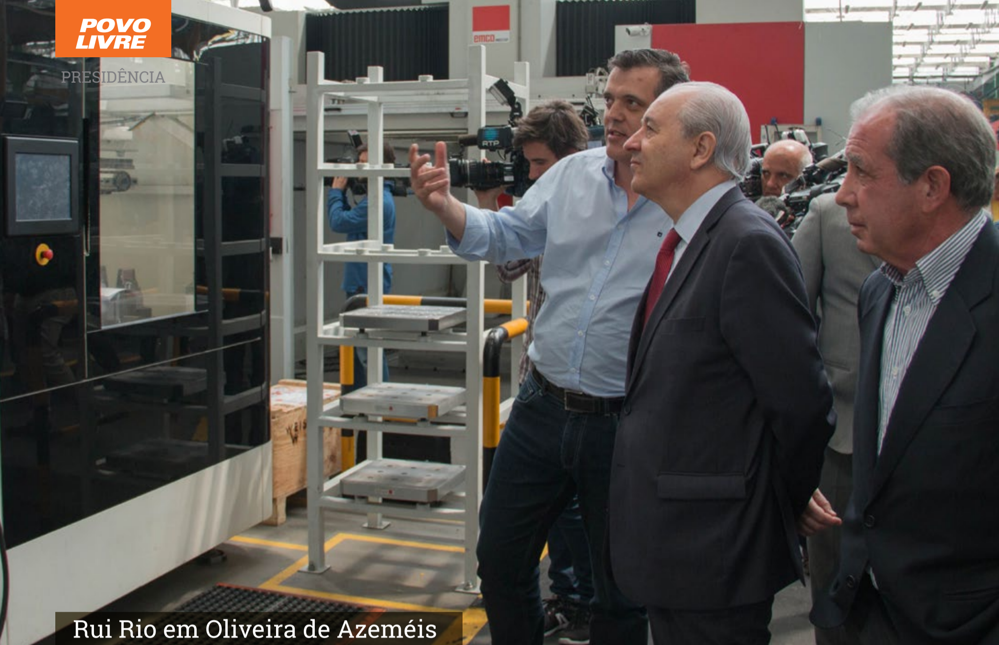
Rui Rio em Oliveira de Azeméis