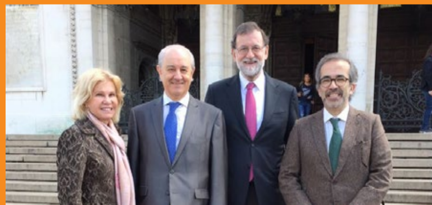
À margem da Cimeira do PPE, o presidente do PSD teve um encontro com o presidente do governo espanhol, Mariano Rajoy.

“O PSD está, obviamente, ao lado dos interesses de Portugal e dará ao Governo toda a força necessária para que Portugal consiga obter um resultado o melhor possível num cenário que é um pouco adverso”, reiterou o líder do PSD, a propósito do orçamento comunitário. Salientando que “o início [da proposta da Comissão Europeia] é mau”, reiterou que os social-democratas contribuirão para que o Executivo defenda “da melhor maneira os interesses” do País.