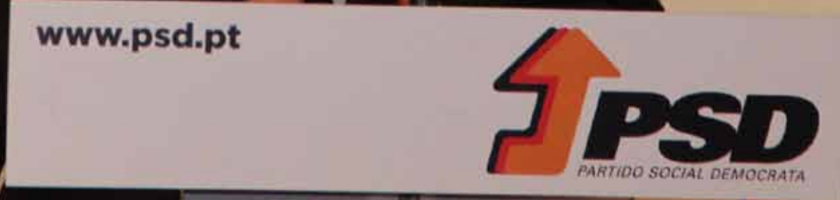
Pedro Passos Coelho esteve no jantar de Natal do PSD de Alijó