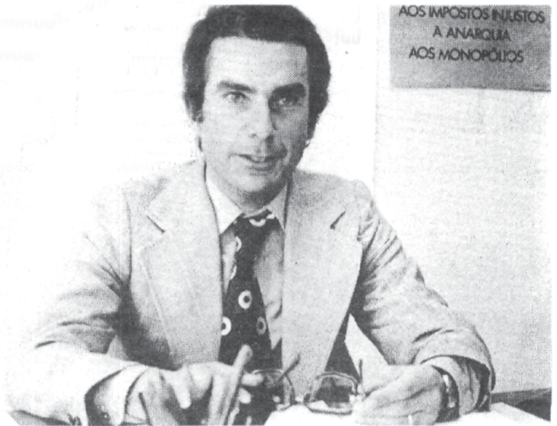
Sá Carneiro, secretário-geral do Partido Popular Democrático

O dr. Sá Carneiro, secretário-geral do Partido Popular Democrático, numa oportuna troca de ideias, formula conceitos, precisa intenções e, mais do que isso, baliza a trajetória actual e futura de um Partido «jovem, descomprometido e dinâmico.»