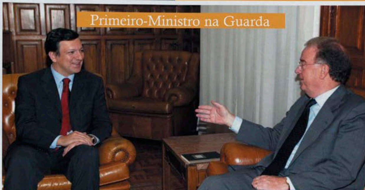
Primeiro-Ministro na Guarda

Internet: www.psd.pt - E-Mail: povolvre@psd.pt